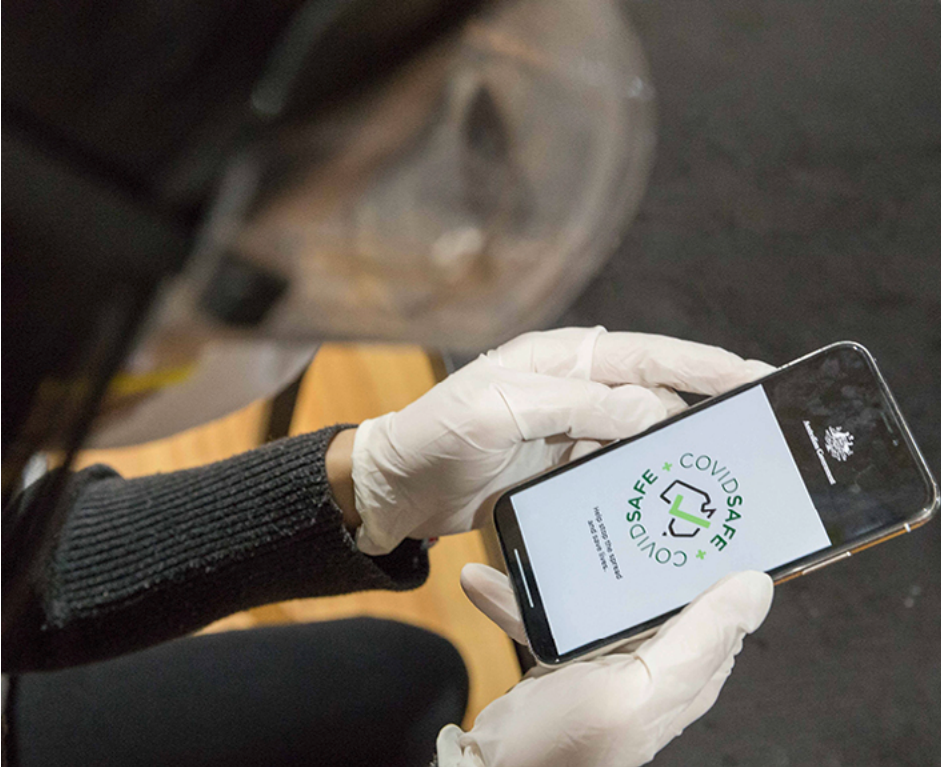
COVIDSafe: In Australien ist die Tracing-App des dortigen Gesundheitsministeriums bereits seit Ende April im Einsatz.

Tracing-App und digitaler Corona-Ausweis – die Digitaltechnik soll den Weg aus dem Corona-Lockdown ebnen. Doch es gibt rechtliche Bedenken. Macht der Datenschutz den Unternehmen und der Politik einen Strich durch die Rechnung?