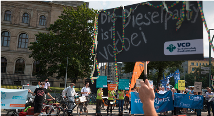
Dieselskandal: Seit Jahren erhitzt er die Gemüter – schon 2017 traten Demonstranten beim „Diesel-Gipfel“ mit Mundschutz auf. Damals noch, um ihre Kritik an der Belastung durch Dieselabgase zu verbildlichen.

Die Generalanwaltschaft des Europäischen Gerichtshof (EuGH) hat Ende April in einem Schlussantrag alle Abschaltvorrichtungen in Dieselfahrzeugen als illegal gewertet, sofern der Schadstoffausstoß dadurch im Normalbetrieb über den vorgeschriebenen Grenzwerten liegt. Ausnahmen hiervon seien eng auszulegen.