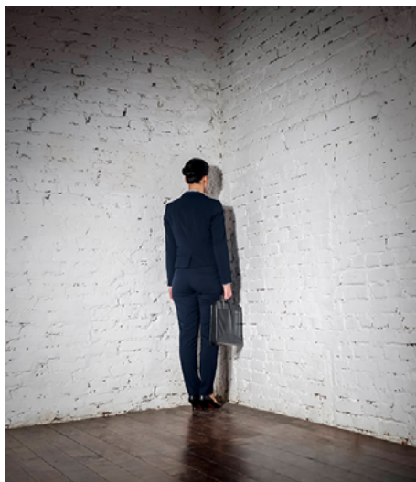
In der Büberecke: Auf Unternehmen kommen mit dem nun offiziellen Entwurf zum VerSanG einige Änderungen zu.

Weiterhin bemerkenswert: Es gibt kaum Änderungen bei den besonders zu belohnenden